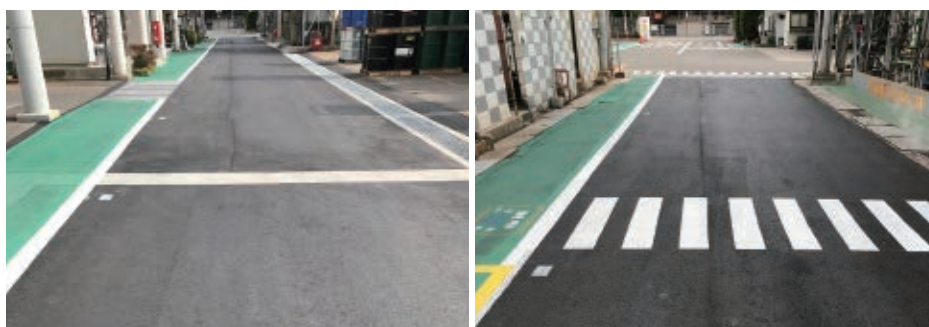
転倒防止対策を目的に整備された構内道路と側溝