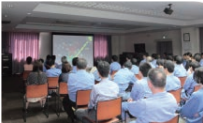
ISO 14001自覚教育 (DVD視聴)

またこの統合に向けて、活動内容についても新規格 (ISO 14001:2015) での運用に移行しました。そのため新規格に基づいて、変化する環境やニーズに確実な対応を行い、事業活動全般に関して環境への影響を評価し、更なる環境負荷低減、継続的改善に取り組んでいます。