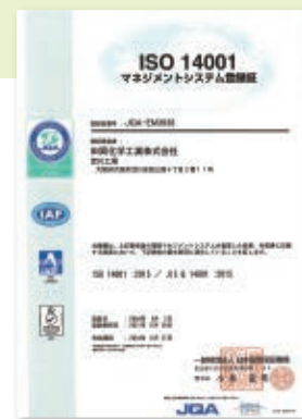
ISO 14001 認証登録証