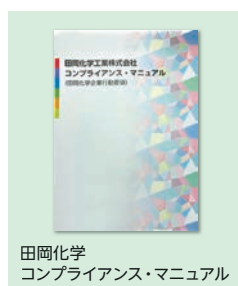
田岡化学 コンプライアンス・マニュアル

当社は、当社役職員が事業活動上遵守すべき法令や規則・規程およびそれらの要点等が記載された「コンプライアンスマニュアル(田岡化学企業行動要領)」を社則として制定、冊子として発行し、当社役職員に配布するとともに、研修等において活用することで、当社役職員のコンプライアンスに関する知識の習得や意識の醸成を推進しております。