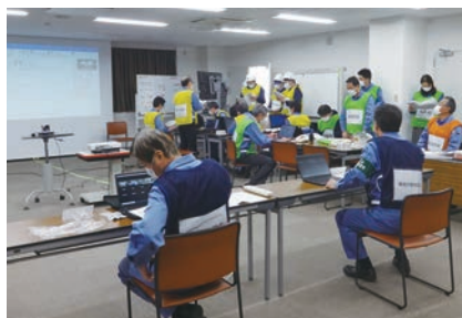
淀川工場での模擬訓練

当社は、事故・災害が発生した場合を想定し、救命救急講演会や防災訓練を毎年実施しています。事故・災害発生を想定した模擬訓練においては、問題点を抽出・改善策を検討することでPDCAサイクルを回しております。また、高所作業における事故を未然に防ぐため、淀川・播磨各工場において安全带特別教育を毎年実施しています。