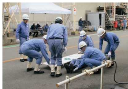
播磨工場での模擬訓練